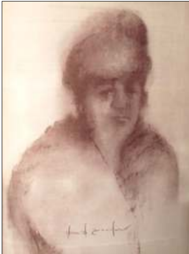
La Rubia de Málaga por David González: Zaafra

En esta época de la transición de los siglos, había terminado de imponerse el género lírico, la zarzuela. El deleite de los públicos por el belcantismo operístico durante el romanticismo y el post-romanticismo, movimiento que llegó casi a los finales del XIX, mutó hacia el belcantismo zarzuelístico , que hacía furor en la mentada época transicional. Pero el género flamenco resistía, a pesar de las competencias que le oponían el género lírico y las varietés , los llamados género chico y género frívolo en competencia feroz para conquistar públicos. Por ello, no faltaron artistas dotados que interpretaban zarzuela y/o variedades a la vez que flamenco. Entre los primeros, son de mentar Antonio Pozo: El Mochuelo y Encarnación Santisteban: La Rubia , además de Manuel Reina: El Canario Chico .