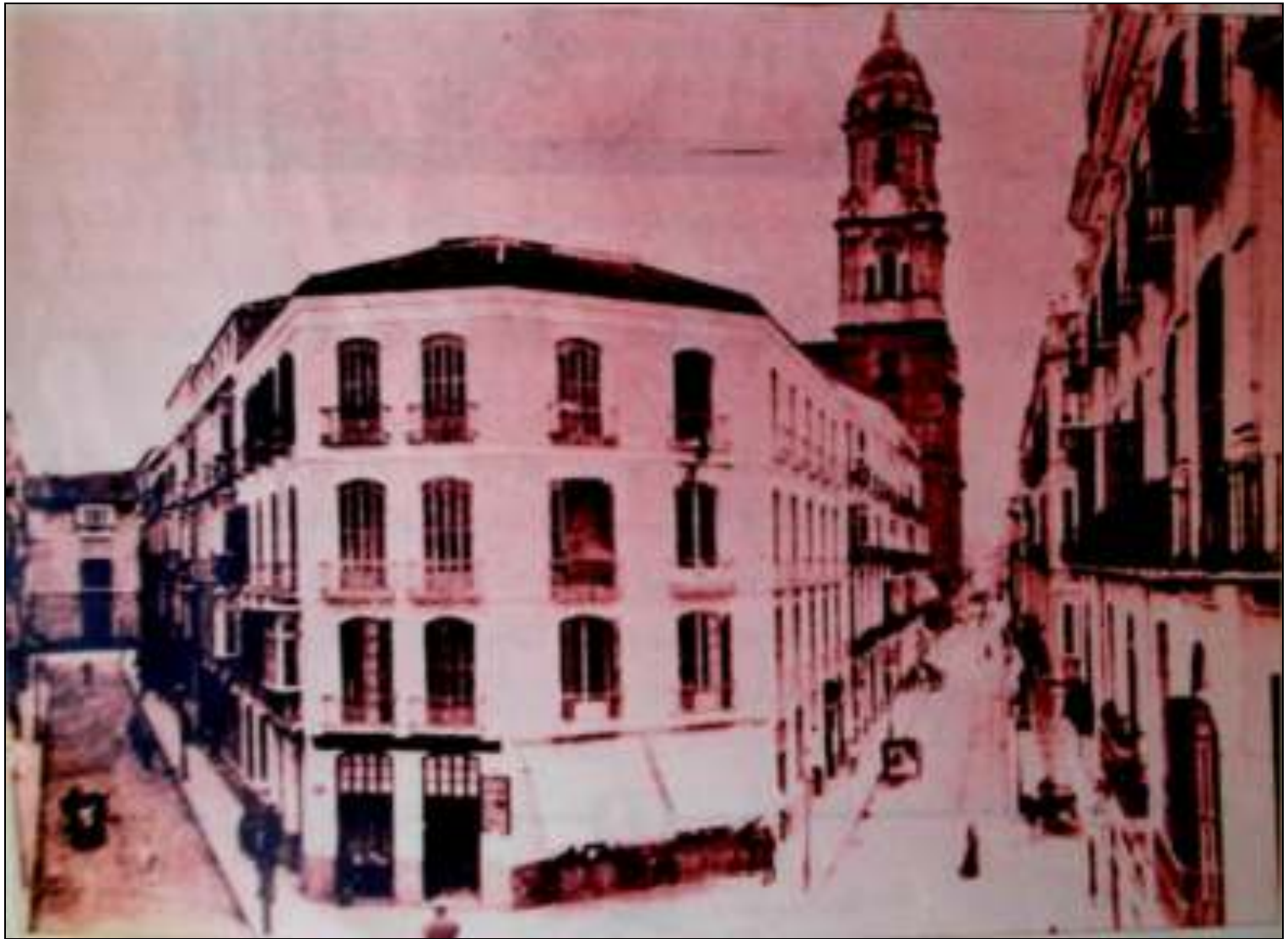
Plaza del Siglo con las calles Duque de la Victoria y Molina Lario.